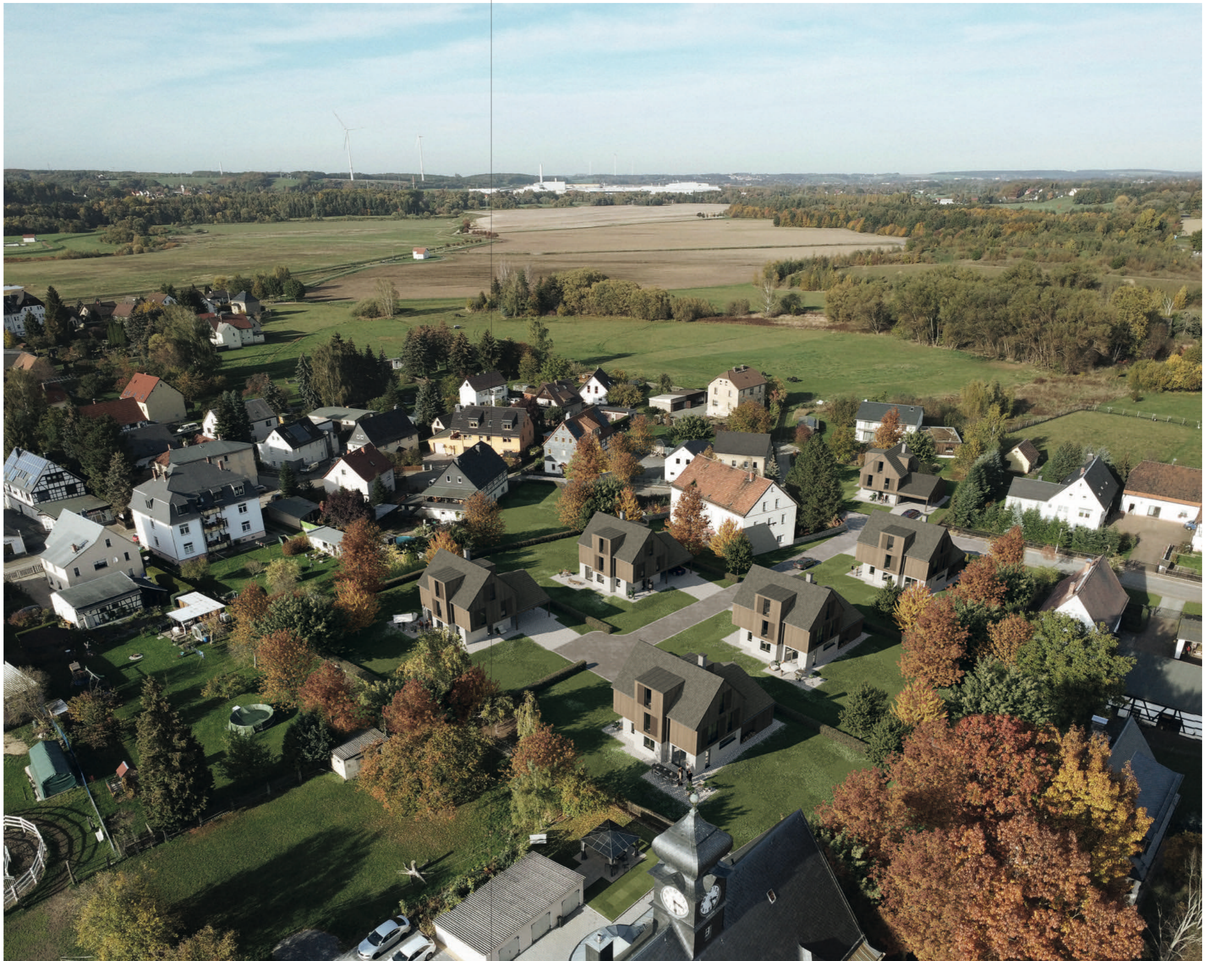
Vogelperspektive: Alte Dorfstraße Crossen